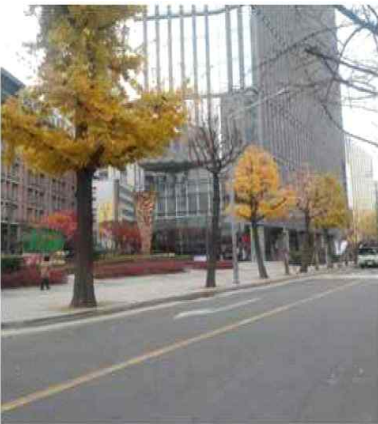
광화문역 1번 출구 정면