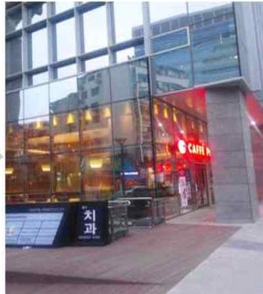
1층 파스쿠치 커피점 옆 계단